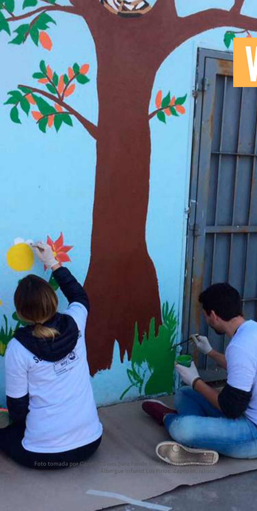
Albergue Infantil Los Pinos, Zapopan, Jalisco.